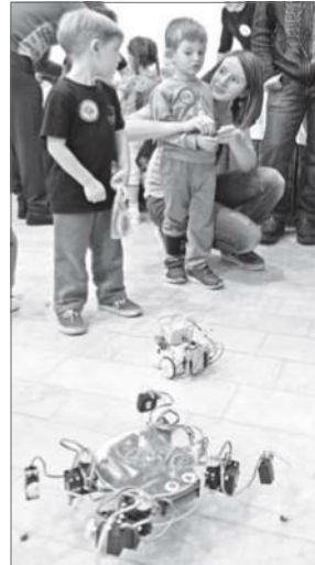
В течение недели будут представлены выставки и презентации. Посетить научные мероприятия могут все желающие.